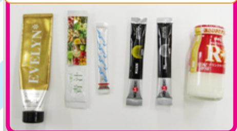
ハンドクリームとサプリメントたち。R-1は昔から必須!