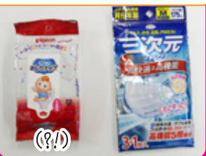
おしり拭きは、出張先でも とても便利でお尻がとても すっきりして使い勝手よし! だぞうですw