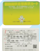
臓器提供カード 提供臓器は 「おまかせ!」