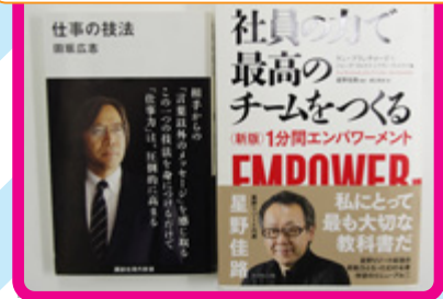
「仕事の技法」 田坂広志