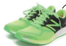
出張先でも ランニング! ニューバランス インソールは、 シダス (膝が悪いので)