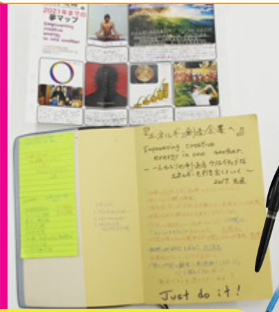
青の蛍光ペンと 8色フリクション