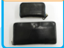
お札と小銭を分けている