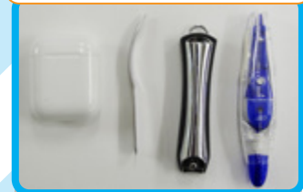
時計は トレードマーク SUUNTO!! 飽きたら くだまいw (山)